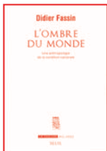
L'Ombre du monde Une anthropologie de la condition carcérale Seuil, La Couleur des idées, 612 pages, 25 euros, janvier 2015

Résultat : les prisons débordent de prévenus, très majoritairement masculins, appartenant aux minorités ethniques – maghrébines, sub-sahariennes, roms –, non parce qu'elles sont plus « toxiques » que les représentants des classes sociales moyennes et « gauloises », mais parce que le droit répressif concerne des actes majoritairement commis dans les classes populaires, décrypte-t-il : délits routiers, infractions à la législation sur les stupéfiants (ILS) et atteintes à l'autorité publique, comptent pour les tiers des incarcérations, explique-t-il. « En 20 ans, le nombre des condamnations a augmenté