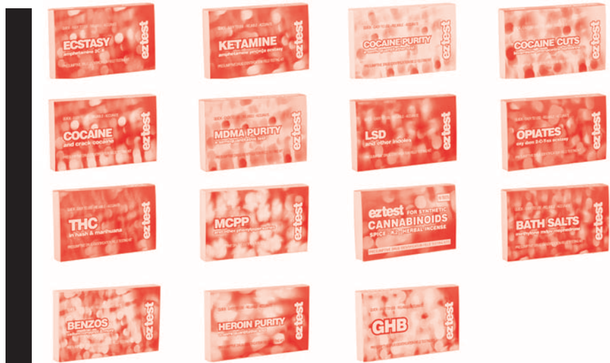
Kits de dépistage de drogues EZ.

Bus 31-32. Initiés vers 2000 par la mission XBT de Médecins du Monde (MDM) qui depuis les transfère progressivement vers des structures porteuses, ces dispositifs sont actuellement les plus développés en France. Le bilan du Bus 31-32 est positif avec un nombre important de produits analysés, de bons retours des usagers et surtout une augmentation des conversations traitant du contenu des produits en circulation. Cependant, leur dispositif est peu financé et tourne avec moins de 0,2 ETP (équivalents temps plein), ce qui impose un rythme lent (deux sessions d'analyse/mois). Cela pose la question de la formation à l'analyse de bénévoles non chimistes ou pharmaciens (possible, comme le montre l'expérience de Technoplus), ainsi que celle de l'utilisation de nouvelles techniques, plus simples, plus mobiles et éventuellement quantitatives. Des changements de protocoles dans le rendu des résultats qui se fait à l'heure actuelle uniquement de manière personnelle à l'utilisateur et par oral pourraient aussi être envisagés.