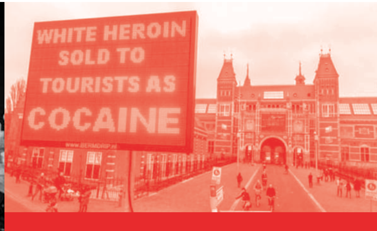
Panneau d'information pour le public sur l'héroïne.

Chromatographie liquide à haute performance (HPLC) mobile du groupe de travail Safer Nightlife suisse (SNS) en milieu festif.