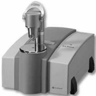
Spectromètre infrarouge Bruker.